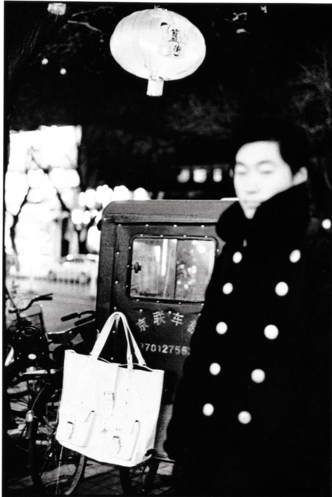
DEVANT UN IMMUABLE CYCLO-POUSSE, un cabas XXL en cuir verni blanc, Mulberry.