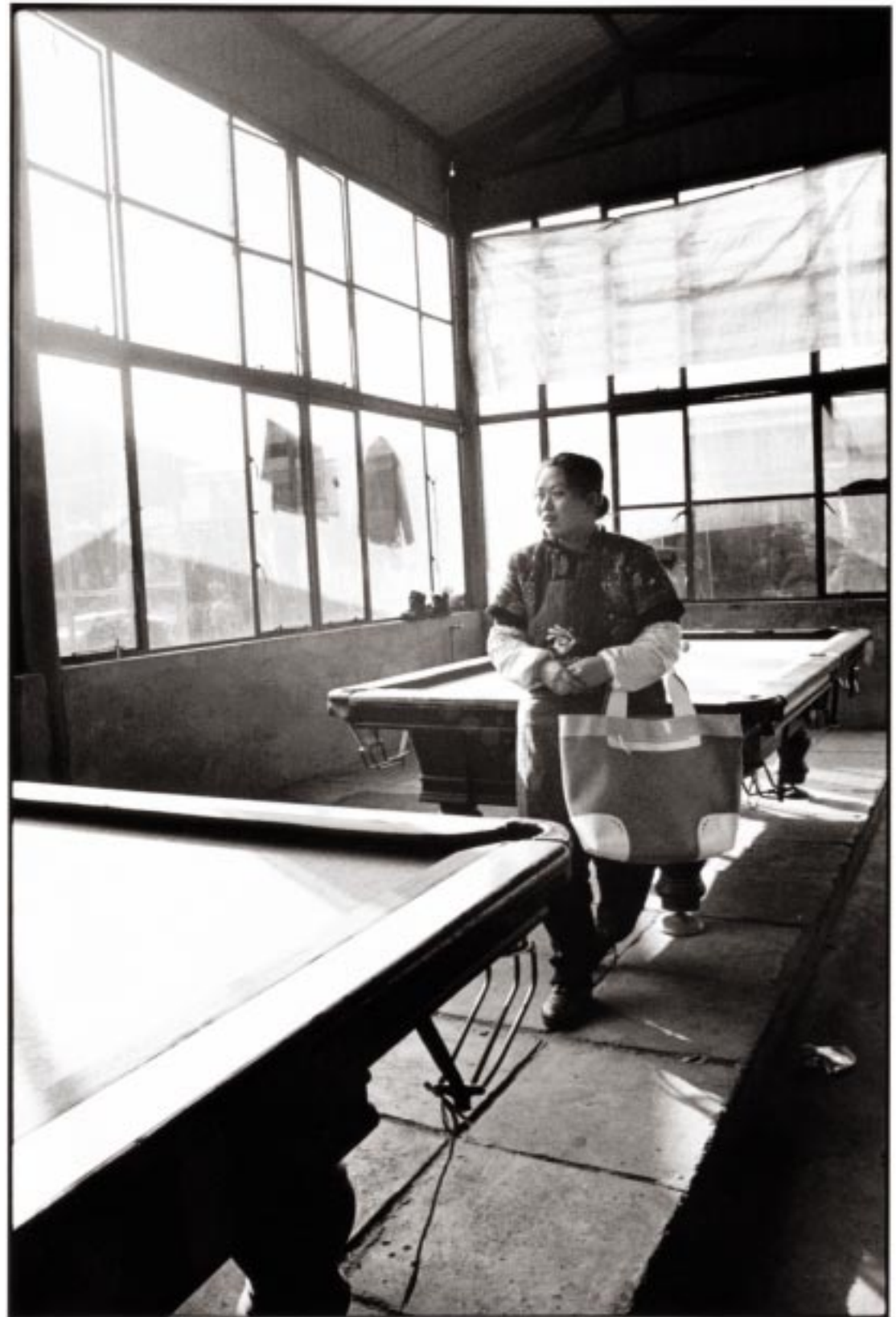
UNE SALLE DE BILLARD À CHAOYANG DISTRICT . Cabas en cuir gold, blanc et cuir verni blanc, Longchamp.