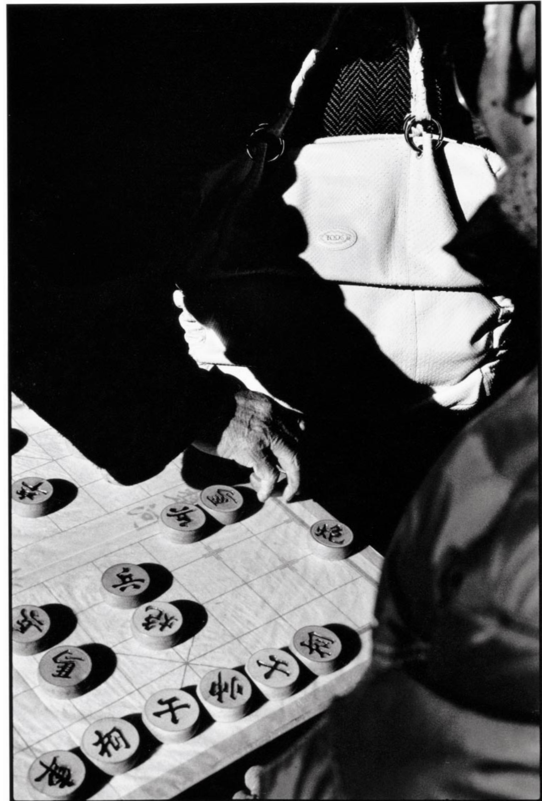
AU PALAIS D'ÉTÉ, un jeu de xiang qi (les échecs chinois). Cabas Softy en python beige, Tod's.