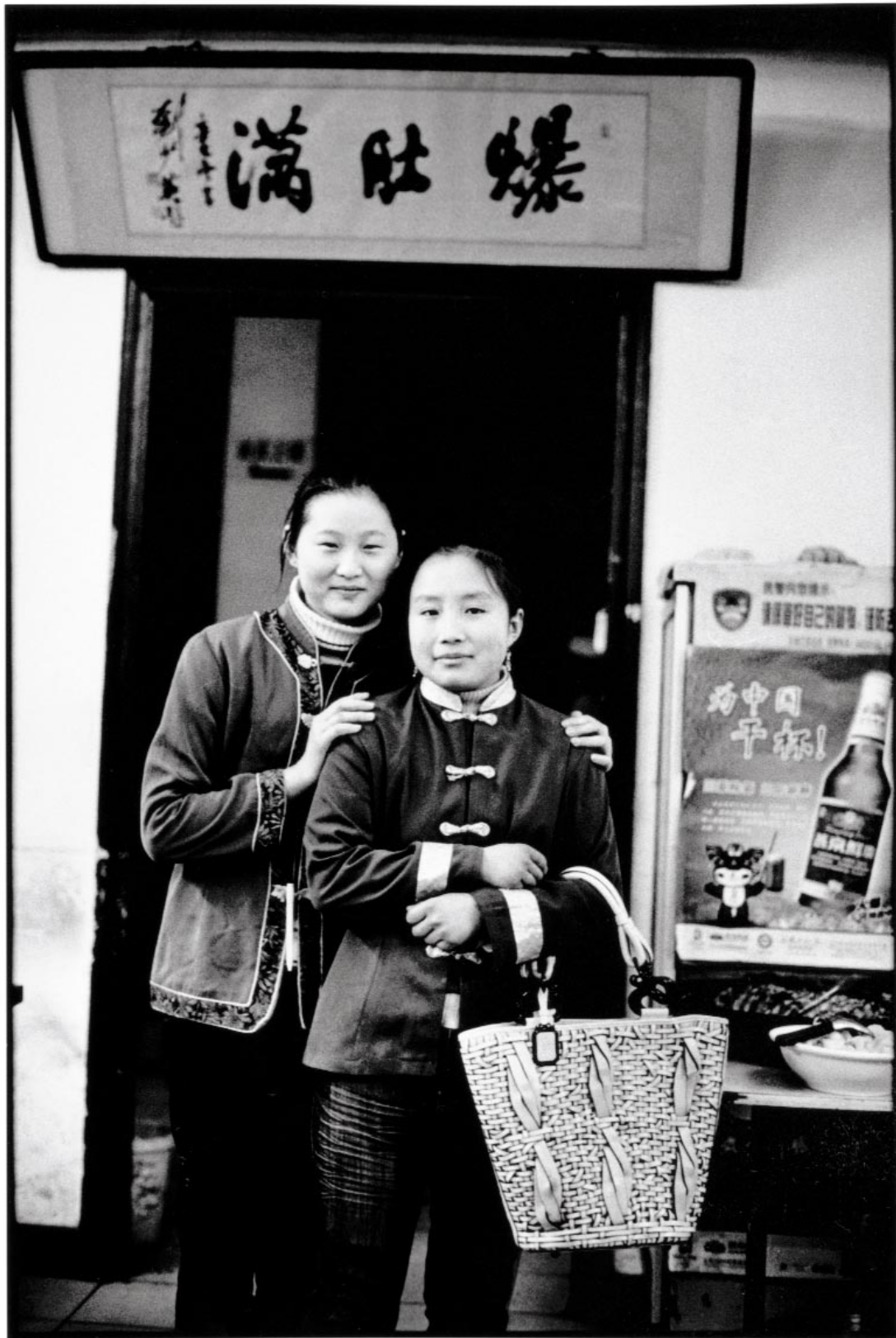
AU CŒUR DE DONG CHENG DISTRICT , deux serveuses de restaurant en uniforme. Panier Dior Samourai 1947, en cuir tressé, anses à motif dragon en résine, Dior.