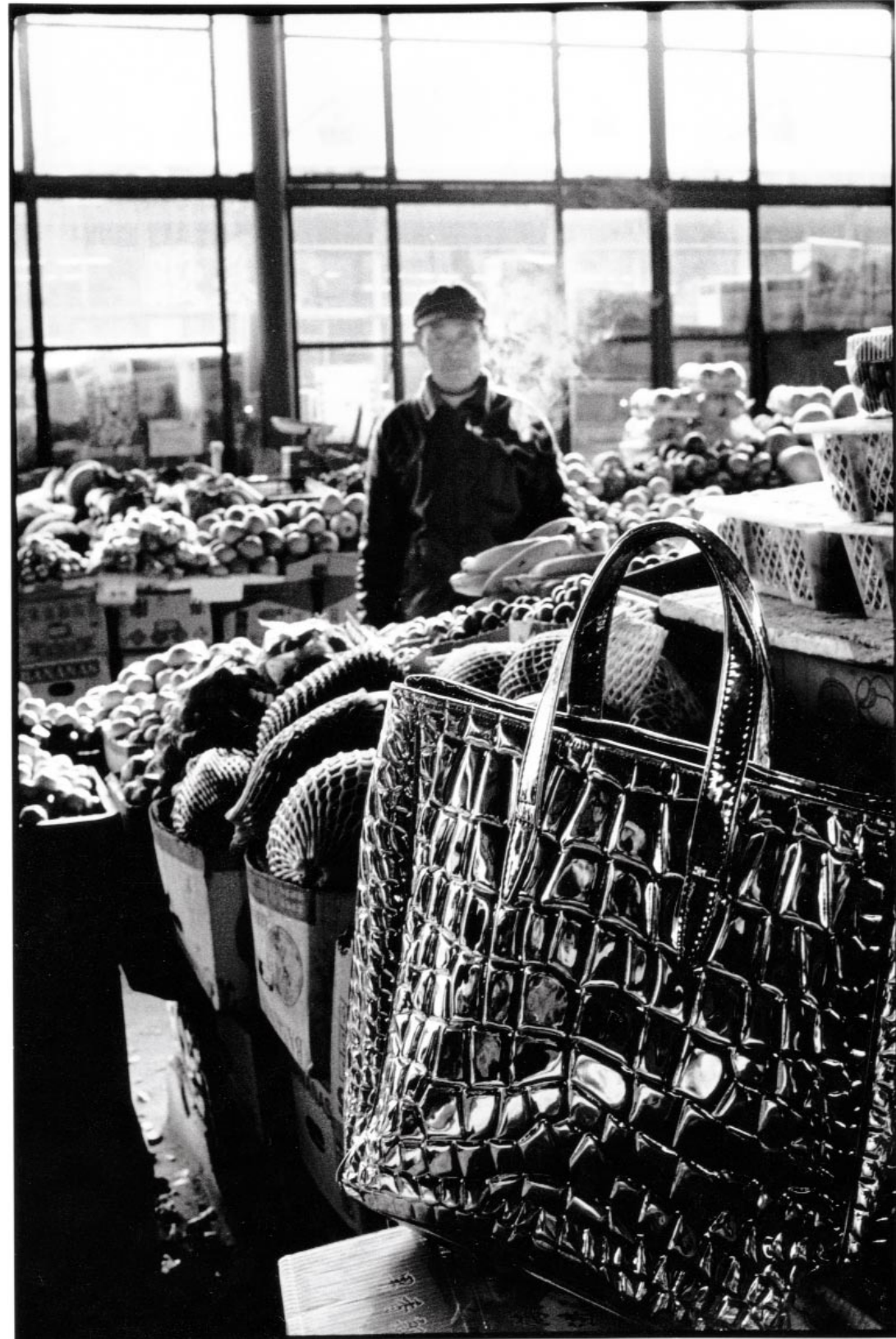
LE MARCHÉ DU QUARTIER DE CHAOYANG. Cabas Raspail, en cuir argent embossé façon croco, Yves Saint Laurent. STYLISME SABINE CARRANCE