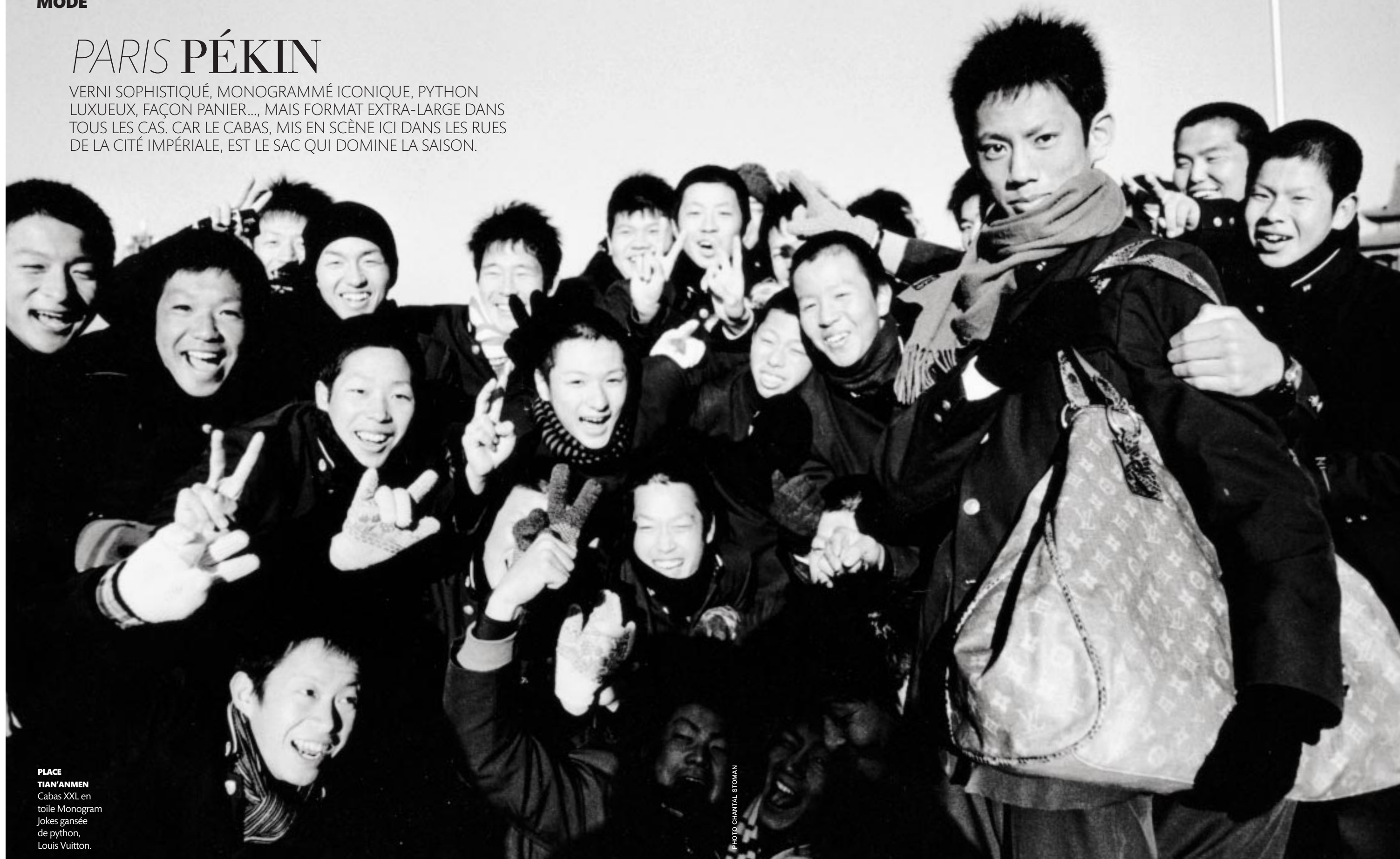
PLACE TIAN'ANMEN Cabas XXL en toile Monogram Jokes gansée de python, Louis Vuitton.

VERNI SOPHISTIQUE, MONOGRAMMÉ ICONIQUE, PYTHON LUXUEUX, FAÇON PANIER..., MAIS FORMAT EXTRA-LARGE DANS TOUS LES CAS. CAR LE CABAS, MIS EN SCÈNE ICI DANS LES RUES DE LA CITÉ IMPÉRIALE, EST LE SAC QUI DOMINE LA SAISON.