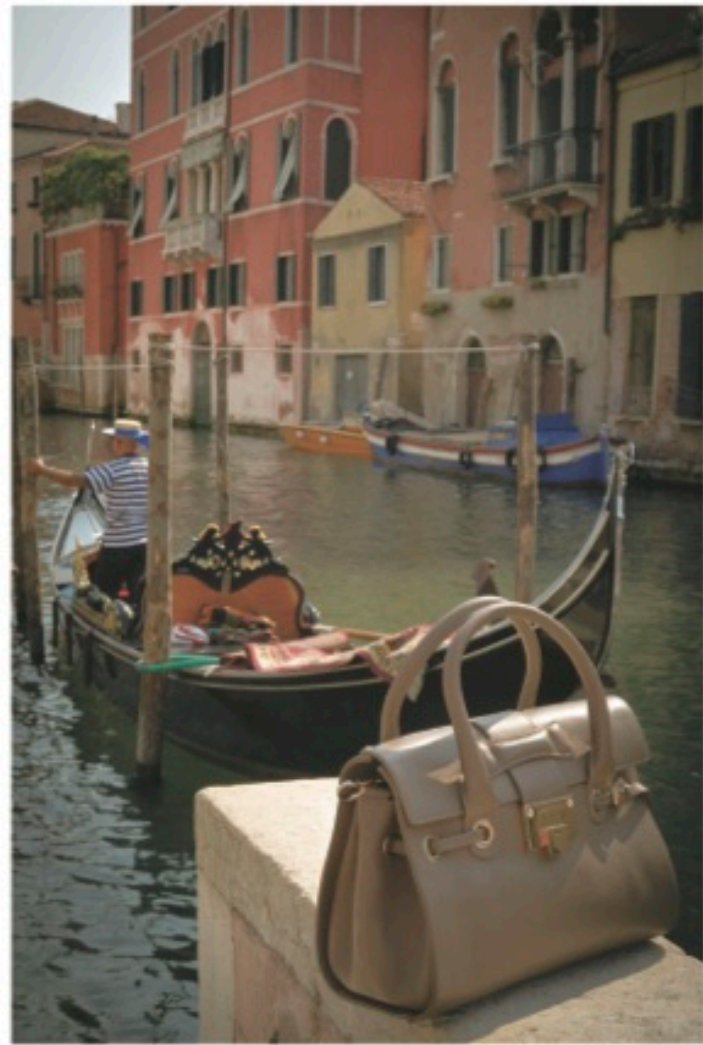
ジミー・チュウの定番バッグはトープカウーを、大人のオーセンティックなスタイルに持たせたい。バッグ [ロザリー S] H24cm ¥138,000 / Jimmy Choo (ジミー・チュウ)