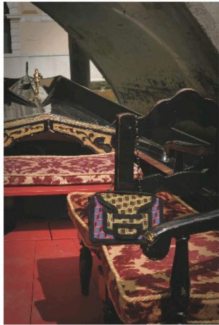
トートバッグ/カウチーグーゼットー (1950年代) / ショッピングバッグ / トートバッグ (1950年代) / H.40cm ¥34,000 / Pink Honey (スエード / 2877)