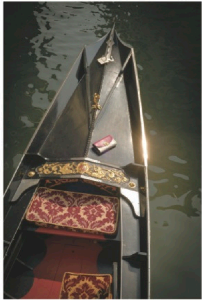
ホワイトとピンクのバイカラーが高級な佇まい。スクエアフォルムのクラッチバッグ [ビバ リスト] H12cm 参考商品 / Sergio Rossi (セルジオ・ロッシ カスタマーサービス)