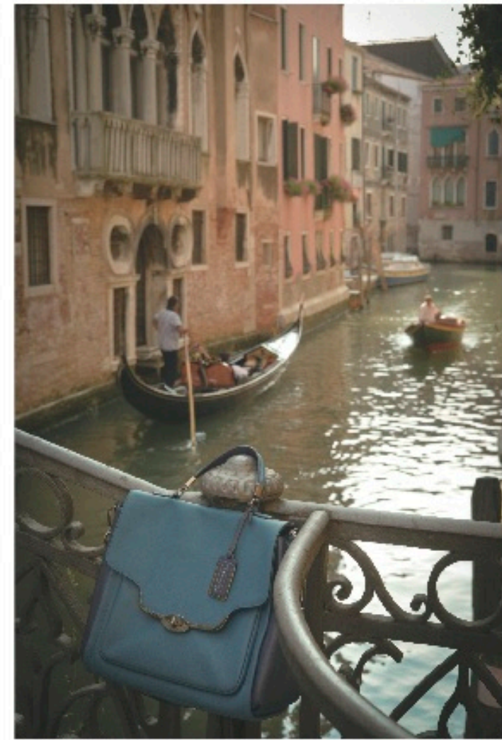
トートバッグ/カウチーグーゼットー (1950年代) / ショッピングバッグ / トートバッグ (1950年代) / H.40cm ¥34,000 / Pink Honey (スエード / 2877)