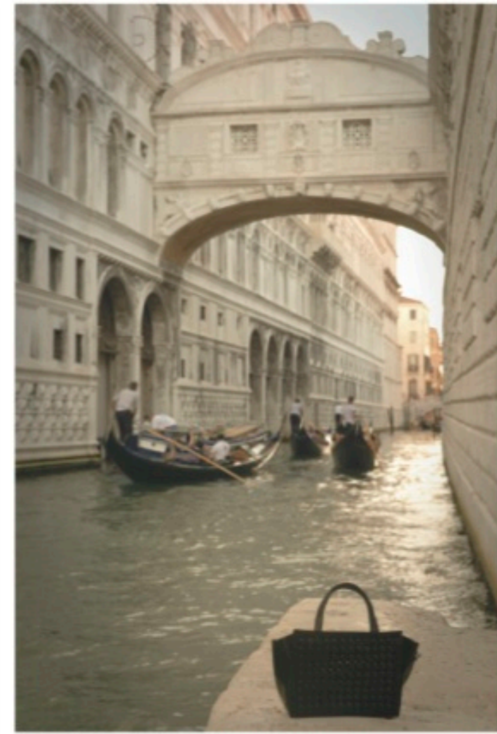
アンテプリマのアイコン、ワイヤーコードとパサントレザーを組み合わせて。バッグ [グラウンダ トレッテ] H20cm ¥79,800 / Anteprima (アンテプリマジャパン)